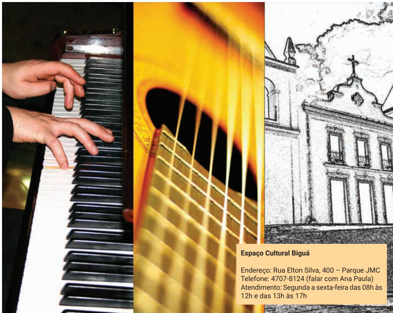
Espaço Cultural Biguá

A Secretaria Municipal de Cultura e Turismo também realiza outras atividades durante o ano como oficinas de teatro, artesanato, canto, capoeira, etc.