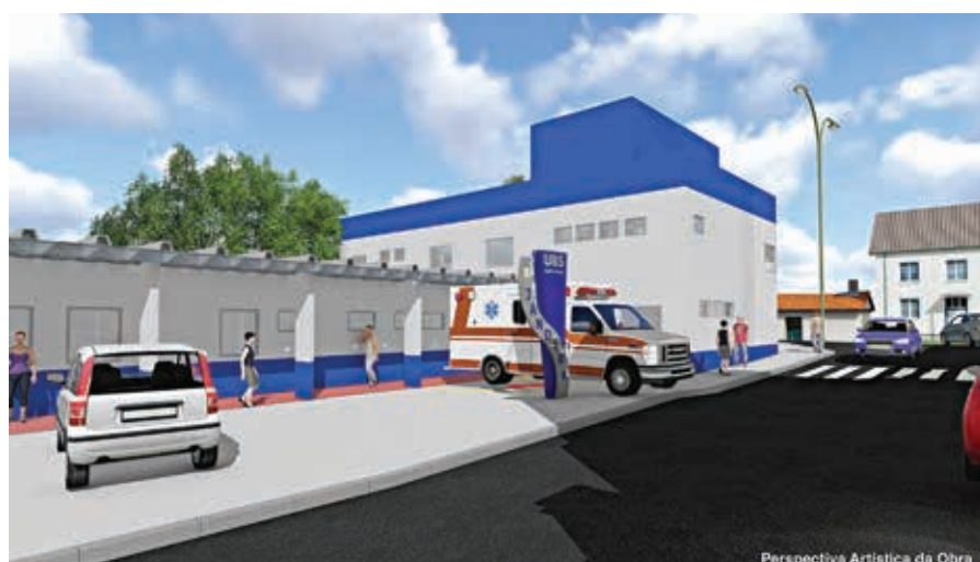
Perspectiva Artística da Obra

Recursos serão empregados na reforma e ampliação da UBS Santa Tereza, além de recuperação de ruas da cidade